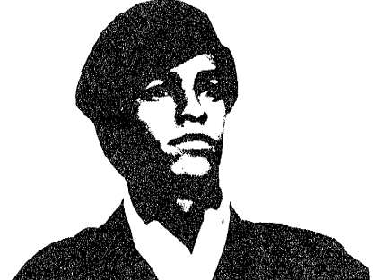
DER FALL HUEY P. NEWTON

Als die Black Panther Party im Oktober 1966 gegründet wurde, organisierte sie ihre Praxis konsequent nach der Erkenntnis des Genossen Mao Tse Tung: „Alle politische Macht kommt aus den Läufern der Gewehre“. Damit wurde sie zu Hauptfeind der Polizei. Einer Polizei, die bis dahin in den Ghettos ungehindert als feindliche Besatzungsarmee auftreten konnte, ohne auch nur den Schein „demokratischer Rechtsstaatlichkeit“ wahren zu müssen. Besonders in Kalifornien, dem Staat, in dem die BPP ihre ersten Aktionen und Kampagnen machte, rekrutierte sich die Polizei aus lumpenproletarischen Südstaatlern, die von der faschistischen Führung mit dem Hollywood-Cowboy Ronald Reagan bewußt zur Unterdrückung des schwarzen Volkes eingesetzt werden. Man würde aber einen großen Fehler begehen, wollte man die Polizeibrutalität nur auf Südstaatenrassismus reduzieren, die Situation in den Ghettos des Nordens und der Ostküste ist ebenso, die Polizei keinen Deut milder. Denn der institutionalisierte Rassismus der USA, der auf lokaler Ebene zur Aufrechterhaltung der kapitalistischen Ausbeutung unbedingt nötig ist, auch wenn er dem Prestige der USA schadet und sich in verschiedenen überregionalen Industriezweigen möglicherweise für die Entwicklung hemmend auswirkt, kann nicht ohne die Kolonialarmee der Polizei auskommen, um die Reservoirs billiger Arbeitskraft zu erhalten und in Schach zu halten.