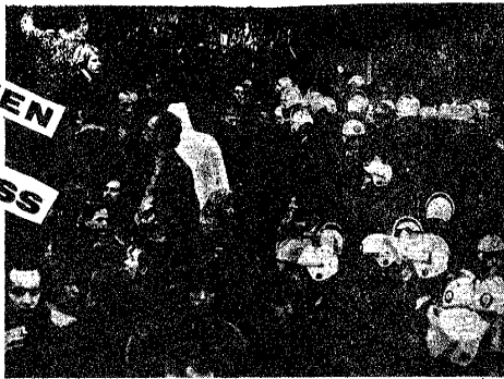
Vor dem John-F.-Kennedy-Institut, in das die konstituierende Sitzung des Übergangskomitees der Freien Universität verlegt worden war, versuchen Polizisten durch eine Ausweiskontrolle links extreme Studenten am Betreten des Gebäudes zu hindern, um weitere Störungen zu vermeiden.

DA MACHTEN WIR SCHLUSS MIT DEM SCHNICK- SCHNACK